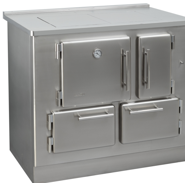
LUSO Cook / 100