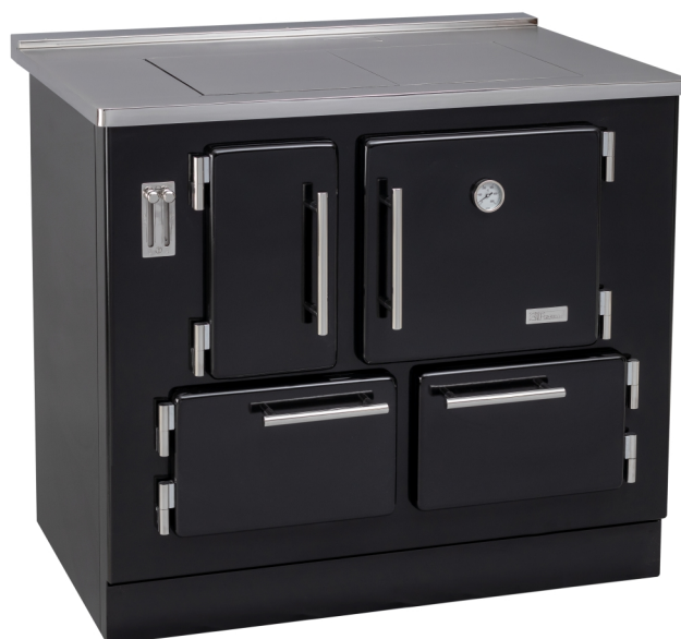
LUSO Termo / 100