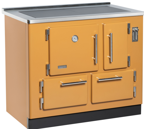
TAMPAS ECO CLEAN